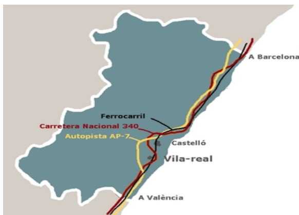
FIGURA 1. Infraestructuras

Situada en la provincia de Castellón al sur de Castellón de la Plana (7km.) y al norte de Valencia (60Km.), accesible mediante automóvil por la CN 340, por la Autopista del Mediterráneo AP-7, por la CV-10 y mediante ferrocarril.